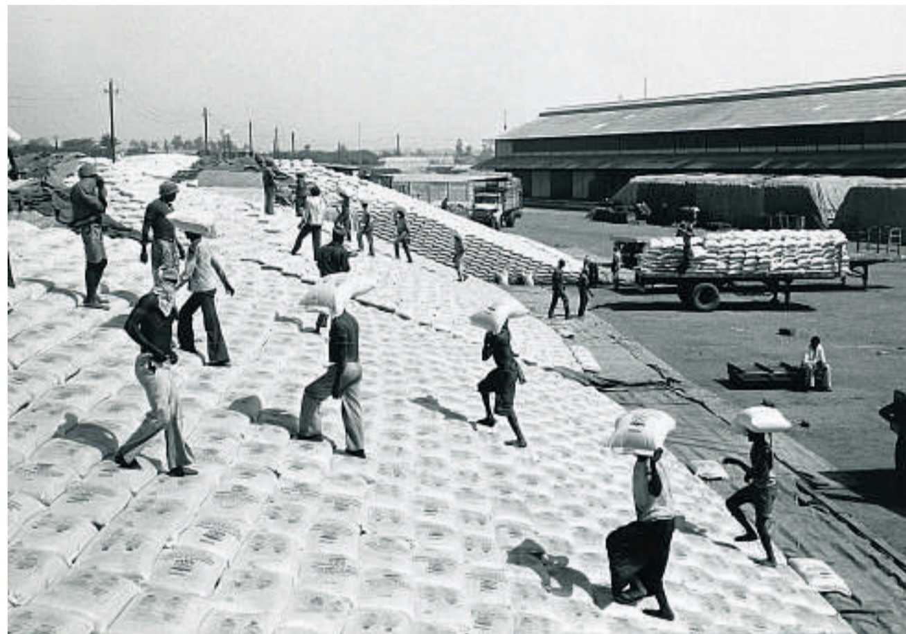
Wie es im Buche steht (obwohl für die Entwicklungsarbeit nicht zentral): Abladen von Hilfsgütern im Sudan, 1984.

Darüber hinaus wird ein längerfristiges Engagement in Nordafrika vorbereitet. Die Deza habe in bestimmten Bereichen die «Voraussetzungen» dazu, sagte Dahinden. Er erwähnte die Demokratisierung lokaler Verwaltungen,