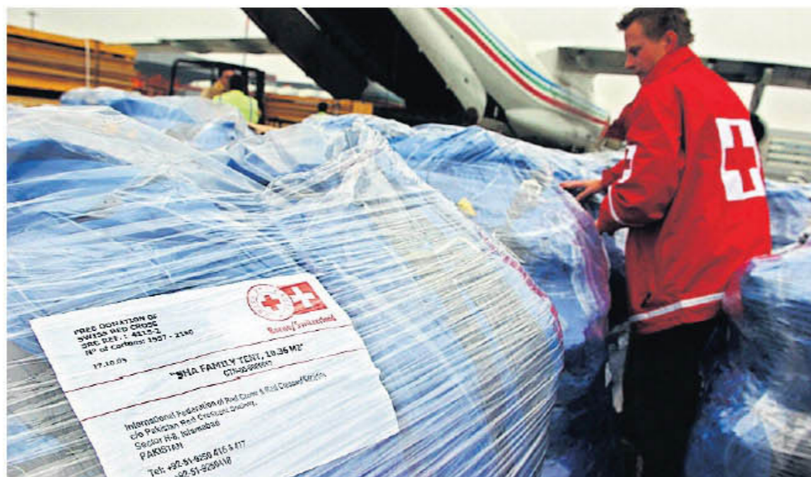
Erdbeben-Hilfe für Pakistan, Oktober 2004.

Das Rote Kreuz war die erste internationale Organisation, die gegründet wurde, um den Opfern bewaffneter Konflikte zu helfen. Es hat seinen Sitz in Genf. Andere Hilfswerke wurden von den Kirchen initiiert (Heks und Caritas zum Beispiel), 1955 wurde Helvetas gegründet, im nächsten Jahr kann die Agentur für internationale Zusammenarbeit (Deza) ihr 50-Jahr-Jubiläum feiern.