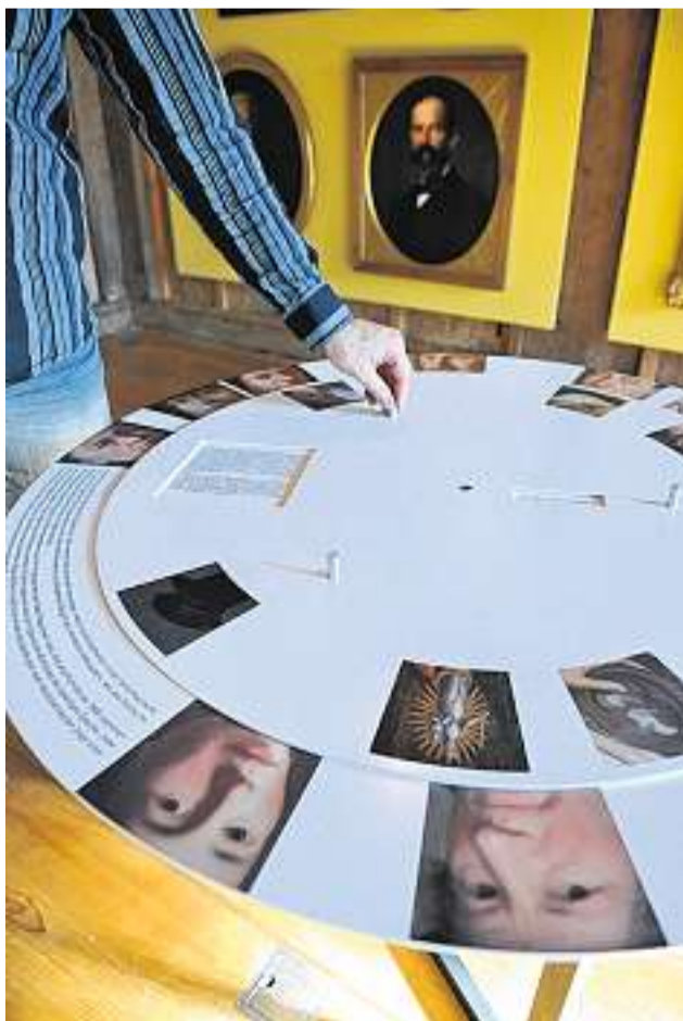
Mitdenken: Ordnet man die Bilder auf dem Drehrad richtig zu, dann bekommt man die gewünschte Information.