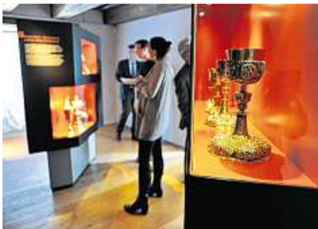
Wertvoll: Das Museum hortet auch kostbare Schätze.