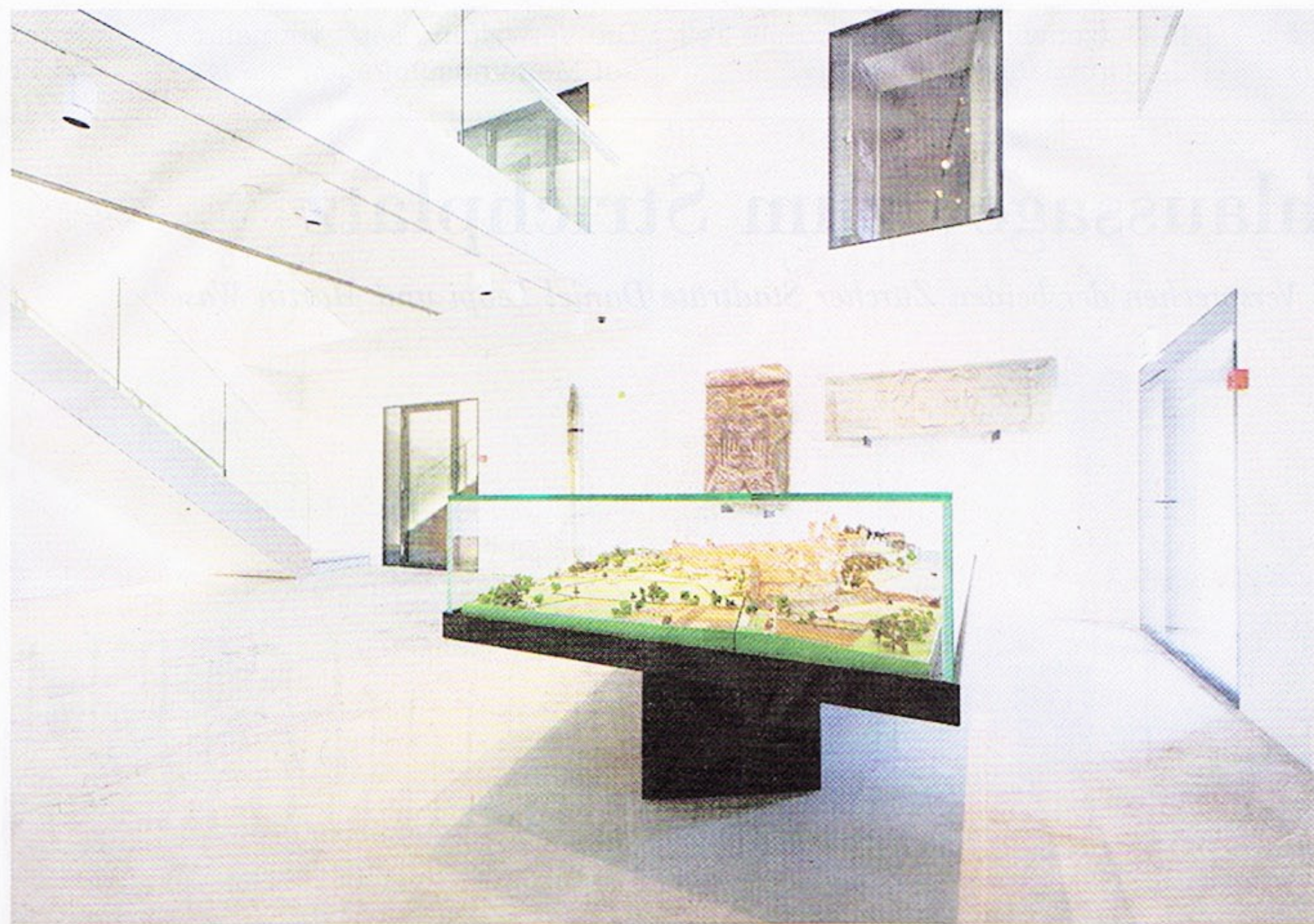
Das Stadtmuseum Rapperswil-Jona empfängt mit Schnörkellosigkeit – und einem Modell aus dem 18. Jahrhundert.

werden am en haben, Beschrän- auf allen Schülerin- n wollen. dank klei- rössen-In- ntionalvor- Vorstoss. 25 Schul- nverbind- ng. Meist rschritten ilt werde. ion und henunter- o Schüler. enzimmer nur einge- hreibt die e lässt die pielraum: für Mehr- verschie- rderungs-