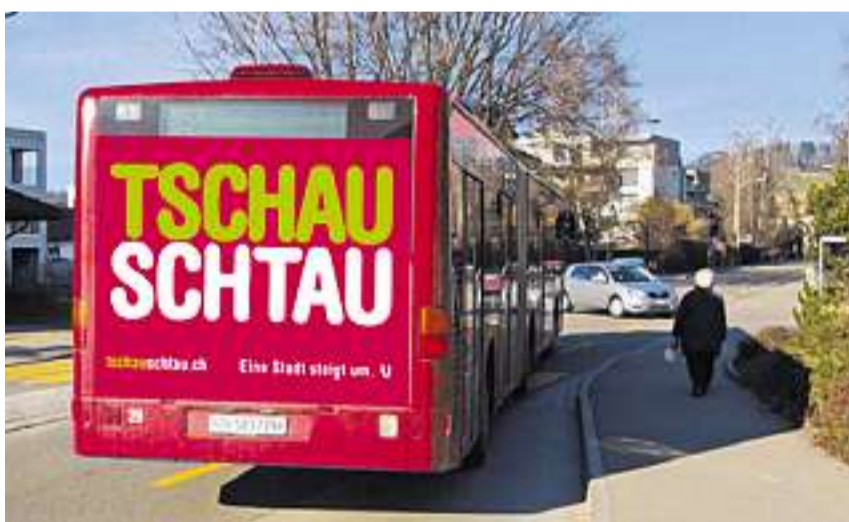
Mehr Aufmerksamkeit für den Bus: Die VZO lancieren in Rapperswil-Jona die Werbekampagne «Tschau-Schtau».

Mit dem Jekami zur Verkehrsbelastung in Rapperswil-Jona hat ein Prozess begonnen, dessen Ende aber noch etwas dauern wird. Die Umsetzung mehrheitsfähiger Lösungen wird erst in einigen Jahren erfolgen. So lange will der Stadtrat jedoch nicht tatenlos zusehen, wie der motorisierte Individualverkehr den öffentlichen und Langsamverkehr derart behindert respektive stört, dass der gesamte