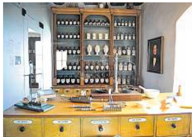
Medizin anno dazumal: Die Bahnfahrgeräusche 1876.