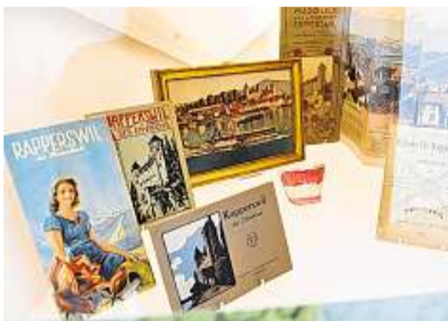
Schön: Die Stadt ist seit Jahrzehnten ein Touristenmagnet.