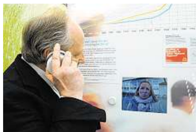
Zuhören: Jugendliche erzählen, was sie von der Stadt Rapperswil-Jona halten.