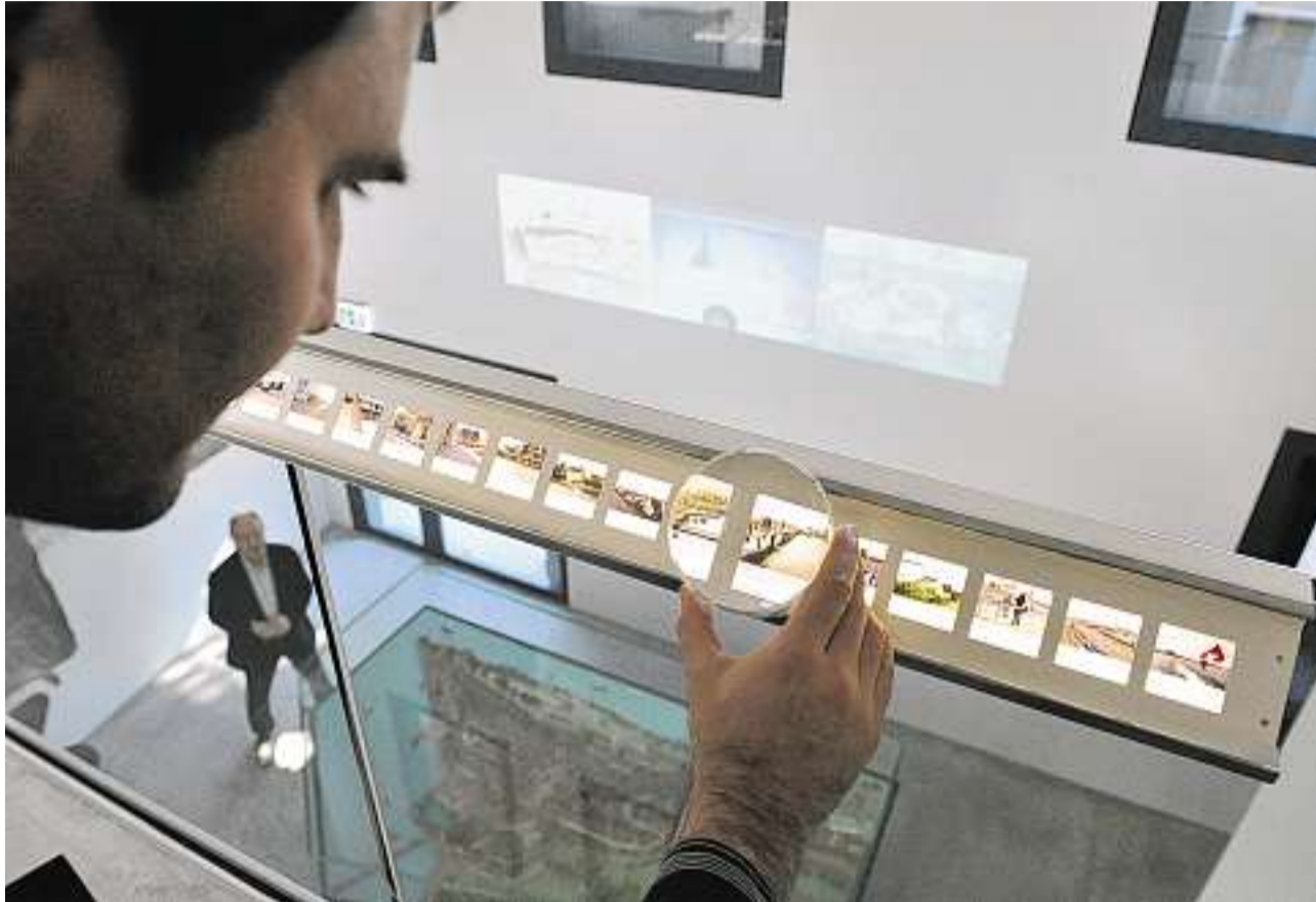
Über- und Durchblick: Eine verschiebbare Lupe lädt zu einer virtuellen Stadtrundfahrt ein.

Rapperswil-Jona. – Am kommenden Wochenende öffnet das neue Stadtmuseum von Rapperswil-Jona offiziell seine Tore. Dann laden Ortsgemeinde und Stadt die Bevölkerung dazu ein, das neue Museum gratis zu entdecken, und zwar jeweils von 11 bis 17 Uhr. Ausserdem werden die beiden Eröffnungstage musikalisch umrahmt: Am Samstag, 16 Uhr, spielt die Feldmusik vor dem Stadtmuseum und am Sonntag, 11 Uhr, die Stadtmusik. (so)