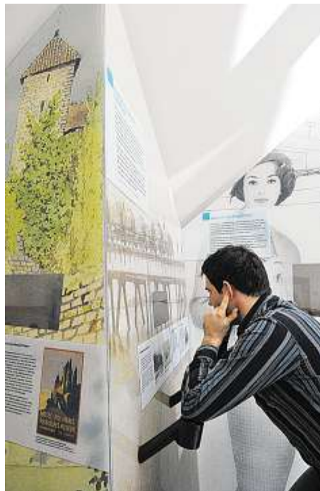
Via Ellbogen: Der Bahnhof klingt durch Mark und Bein.