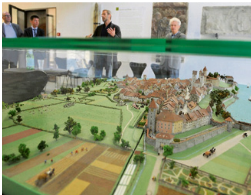
Ein detailverliebtes Modell der historischen Stadt zeigt ein Rapperswil aus früherer Zeit.